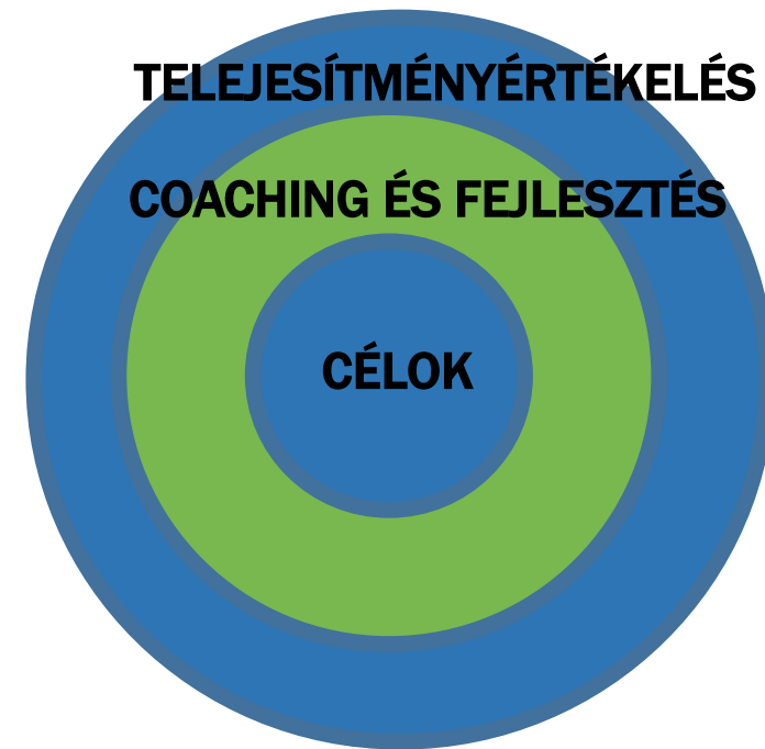
FEJLESZTÉS ALAPÚ FOLYAMAT