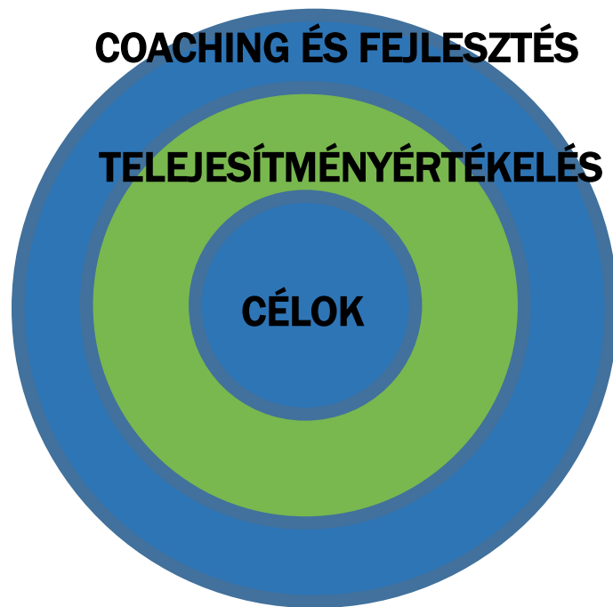
KOMPETITÍV ÉRTÉKELÉS ALAPÚ FOLYAMAT